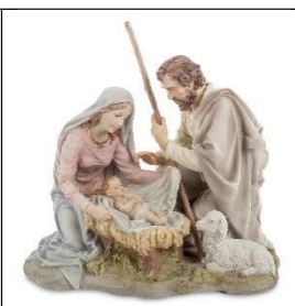
Б) Рождество Христово